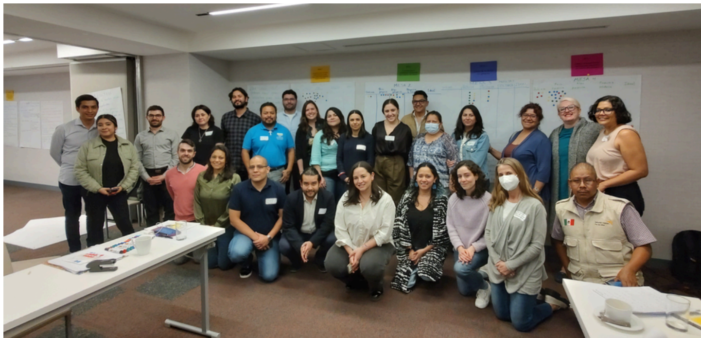
Foto: Encuentro de contrapartes de Iniciativa ARROPA.