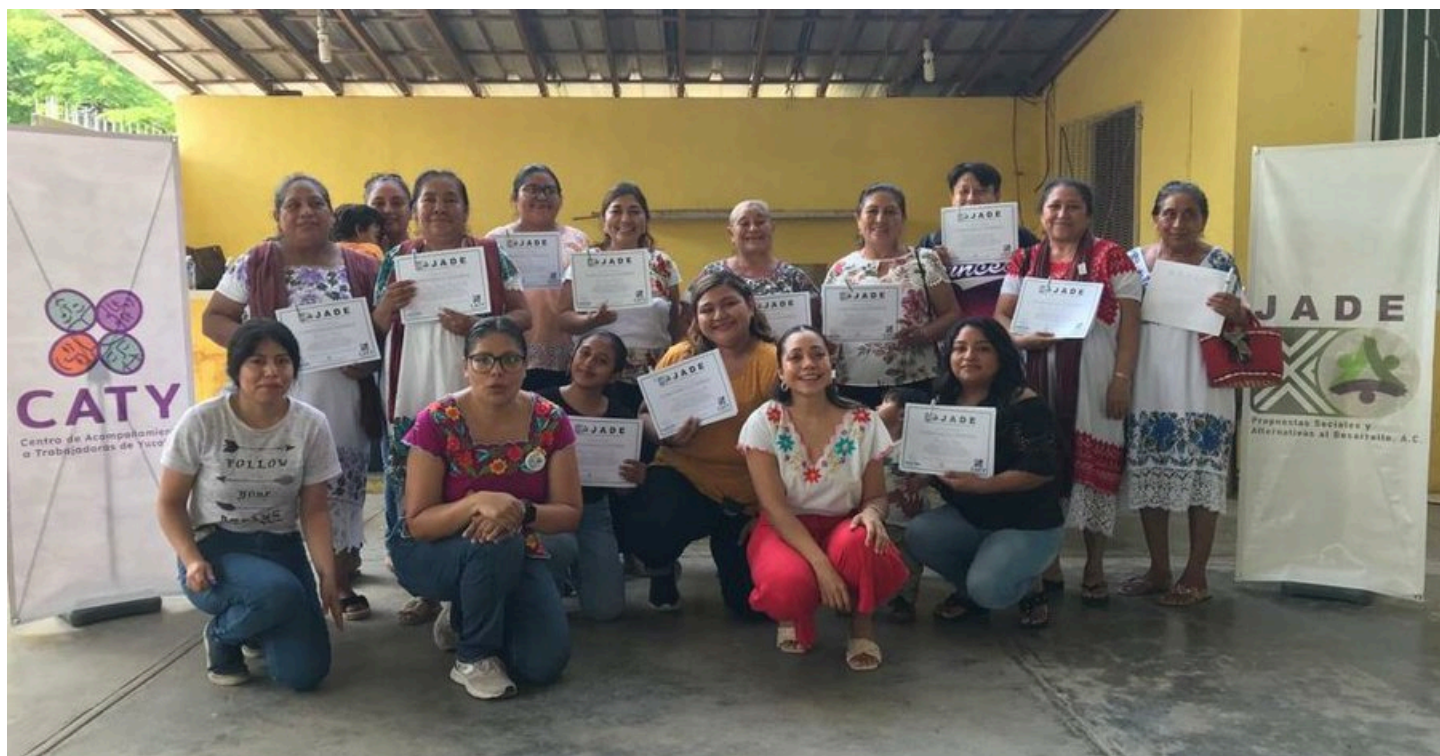
Foto: Clausura capacitación derechos laborales en Sotuta, Yucatán.