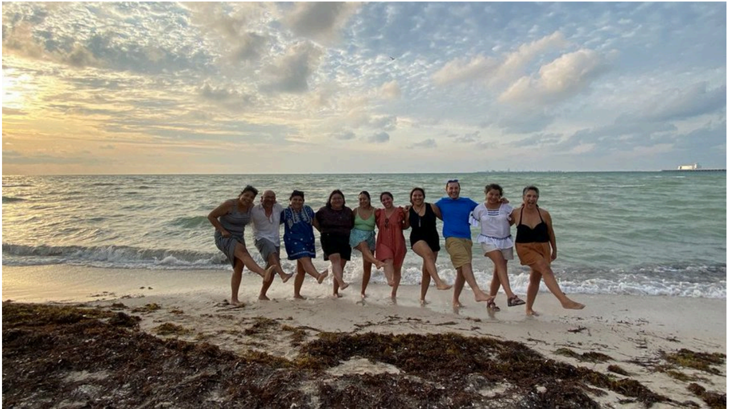
Foto: La equipa de Jade Sociales en día de cuidados colectivos.